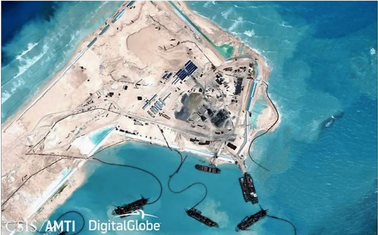
dragage puis dépôt de sédiments sur Fiery Cross (5 novembre 2014)