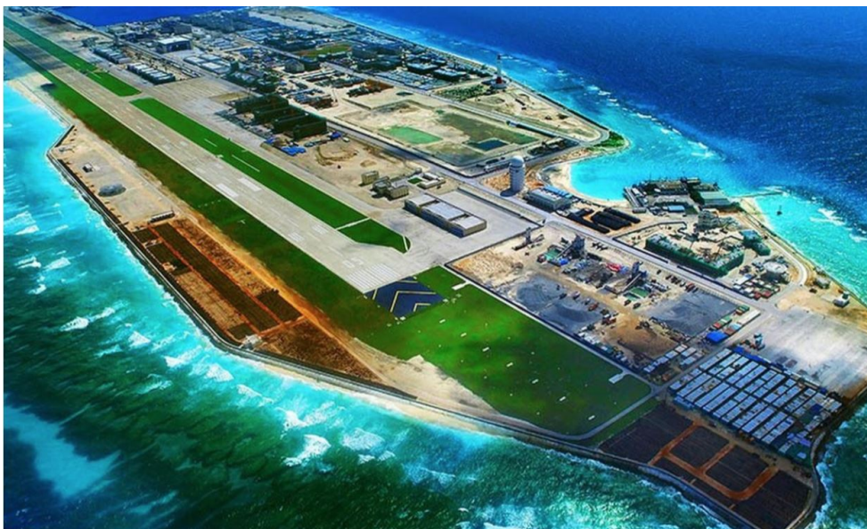
Fiery Cross est devenu une île artificiel à vocation militaire